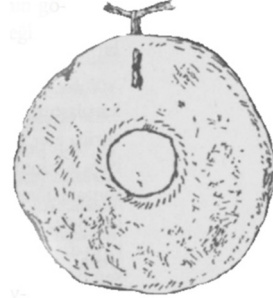
Şekil 1: Yeryüzünü simgeleyen ortası delik demir levha, Yakut şaman elbiselerinden (Harva, 2015, s. 19).

Yaradılışa ilişkin Orta Asya efsanelerinde, dağ ve kutsal mekânlar yeryüzünün göbek deliği olarak görülmektedir. Yeryüzünün bu noktadan (göbek deliği) başlayarak meydana geldiği ve gittikçe büyüyerek şimdiki konumuna ulaşmış olduğu anlatılır. Benzeri düşünce biçimine, Yahudi efsanelerinde olduğu gibi, diğer Önyasya halkları arasında da rastlanmaktadır. Yeraltı dünyasına ise bir delikten girilir; Altaylardaki Tatar kabileleri bu deliğe "yeryüzünün duman deliği" adını verirler. Şamanlar bu delik vasıtasıyla yer altı dünyasına gider ve yine oradan geçerek insanların dünyasına geri dönerler. Dolayısıyla yeryüzü ile ilgili çizimlerde bu delik resmedilmektedir. Yakut şamanları ise bundan esinlenerek, elbiselerine genelde yeryüzünü temsil eden yuvarlak bir metal levha iştirirler ki, bu levhalarda duman deliği yeryüzünün ortasında yer almaktadır (Harva, 2015, s. 18). Dünyanın merkezi, Orta Asya halklarının tasavvurlarında "dünyanın göbek deliğinden" yukarılara yükselen heybetli bir dağ olarak yer alır (Harva, 2015, s. 44). Bu nedenle kutsal mekânların oluşumunda eşik olarak görülen dağların seçilmesinde yapılacak yolculukları ve uygulamaların başarıyla sonuçlanmasını kolaylaştıracağı fikrinin ağır bastığı söylenebilir.