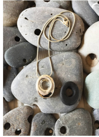
Fotoğraf 1: Koca Karı Taşları (Hag Stones) Fotoğraf 2: Modern Tasarım Koca Karı Taşları

Kuzey İrlanda’da Antrim’e bağlı Doagh bölgesinde Delikli Taş, yüksekçe bir tepede bulunmaktadır ve tarihinin çok eskiye dayandığına inanılır. Anlatılara göre bir kız ve oğlan ilişkilerinde ciddileştikleri zaman Delikli Taş’a giderler. Kız sağ elini taştan geçirir ve erkek de onun elini yakalar ve birbirlerine bağlı kalacaklarına yemin