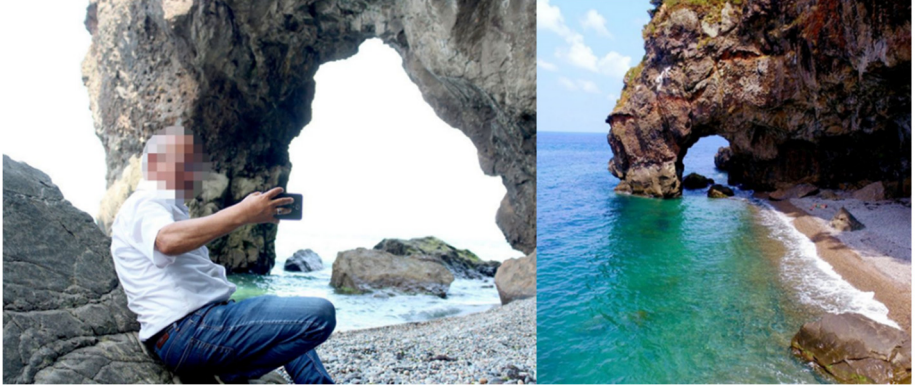
Fotoğraf 18-19: Delikli Taş: Görele, Giresun “Borcu olan, derdi olan, çocuğu olmayan buraya akın ediyor!”

Giresun'un Görele ilçesinde sahilde bulunan falezde oluşan delikli taş son yıllarca çok ilgi çekmektedir. Borcu olan, derdi olan, çocuğu olmayan delikli taştan geçerse dertlerinden kurtulacağına inanılmaktadır (URL7)