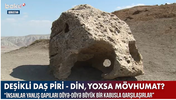
Fotoğraf 10: Pir Abdülkerim Türbesi önünde bulunan delikli taş, Azerbaycan, Gobustan

Gali Yenega/İyi Kadın Taşı olarak bilinen delikli taşlar, Kıbrıslı Türklerle Rumlar tarafından kutsal sayılır. Bunların bolluk, bereket ve uğur getirdiklerine, hastaları sağaltma gücüne sahip olduklarına ve saklanan bir definenin yerini belirleyen işaret taşları olduklarına inanılır. Ayrıca bu taşların içlerinde Afrodit, Meryem Ana ve Nimmph olarak bilinen perilerin bulunduğu inancı da yaygındır (Bağışkan, Ana Tanrıça Kültünün Kıbrıs Folklorundaki İzleri (5), 2015). Bu taşların üzerindeki delikten geçen kimsenin o yıl şanslı olacağı, hastalıklardan korunacağı, o kişiye uğur getireceği ve bütün dualarının kabul edilerek cennete gideceğine inanılır (Keser, 2010, s. 120).