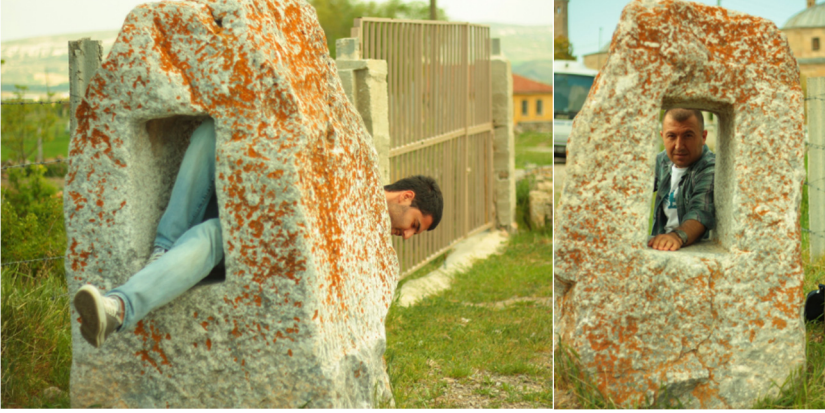
Fotoğraf 15-16: Delikli Taş, Şücaeddin Veli Türbesi, Arslanbeyli köyü, Seyitgazi, Eskişehir

Eskişehir’de Odunpazarı ilçesinde Deliklitaş Mahallesi’nde bulunduğu anlatılan delikli taştan ise günümüzde herhangi bir ize ve hakkında herhangi bir anlatıya rastlanılmamıştır.