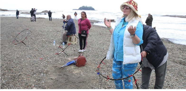
Fotoğraf 20: Sacayağından geçme, Mayıs Yedisi Kutlamaları 2022, Giresun

Kahramanmaraş ili Türkoğlu ilçesi Akçalı Mahallesi'nin kuzeyinde ormanlarla kaplı bir alan içerisinde bulunan Delikli Taş özellikle köy halkının ilgisini çekmektedir. Özellikle çocuklar delikli taştan geçmeye çalışmaktadırlar. Delikli taştan geçenlerin ya altına işeyenler ya da cennetlik kişiler olduğuna inanılmaktadır (Kamalak, 2018).