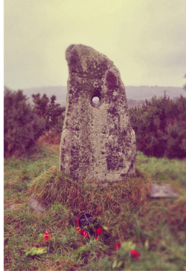
Fotoğraf 3: Delikli Taş (Hole Stone): Kuzey İrlanda, Antrim, Doagh

ederler ve aşklarını ilan ederler. Bazen de çocuğu olmayan erkekler üremeyi sağlamak için cinsel organlarını bu deliğe yerleştirerek dua ederler (URL3).